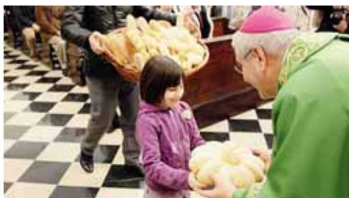
Il momento dell'Offertorio

L'associazione conta 400 iscritti su 410 panificatori del territorio bergamasco e opera «in un settore in continua evoluzione per il lavoro e per i nuovi stili di alimentazione», come