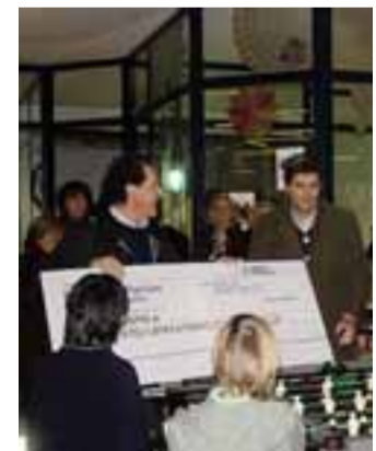
La consegna del maxi assegno

Un riconoscimento per la sua opera meritoria è giunto anche